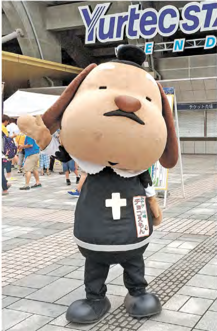
ユアテックスタジアム仙台にベガルタ仙台の応援に来たチョコえもん。「見かけたら声をかけてチョコ！」