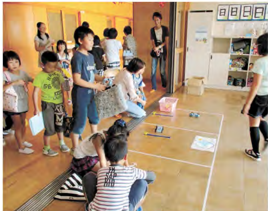
楽しいお店がたくさんありました

伊里前小学校では、毎年9月に「たつがねっ子まつり」という児童会行事が行われます。今年のスローガンは、「みんなで協力し、笑顔