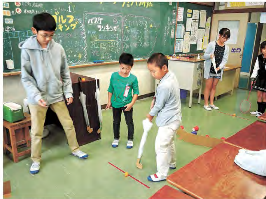
「ラウンドワン!六郷店」ではゴルフ、バスケットボール、卓球などをみんなで楽しみました

六郷小は今年、東六郷小学校と統合しました。新しい仲間と楽しい学校生活を送っています。東六郷小の伝統である黒潮太鼓も受け継ぎました。