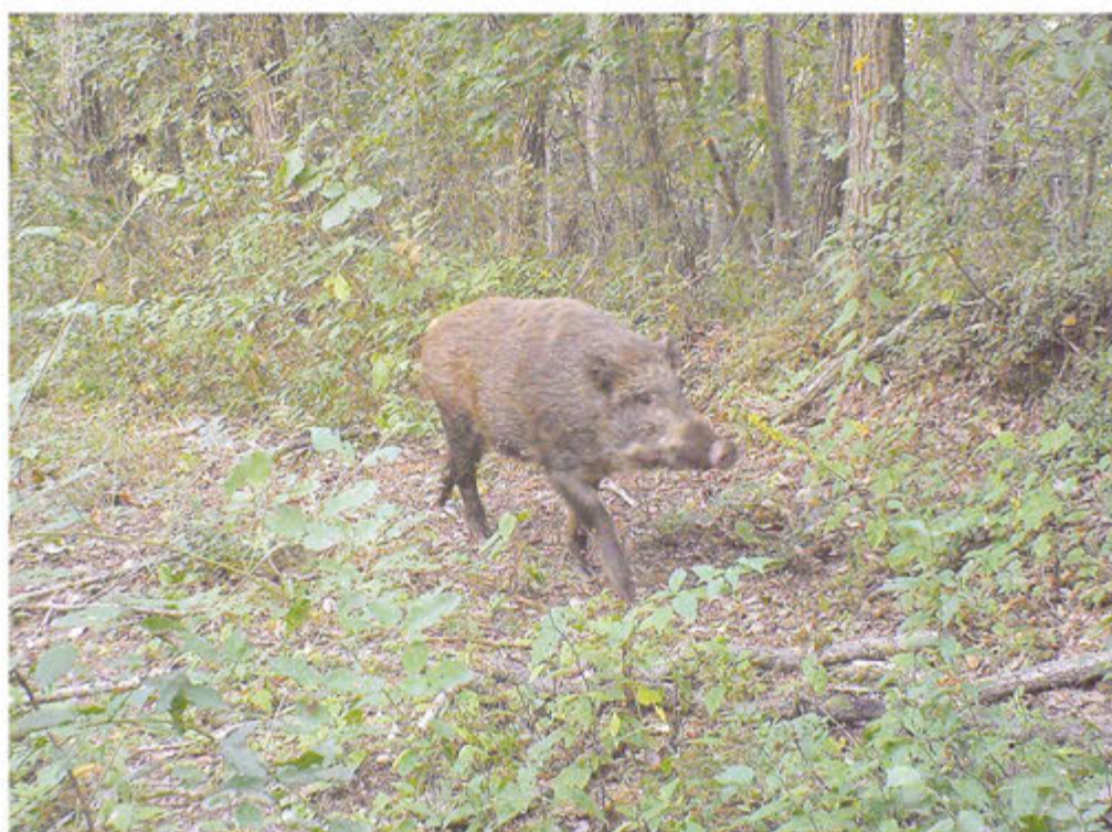
宮城県大衡村で見つかった野生のイノシシ