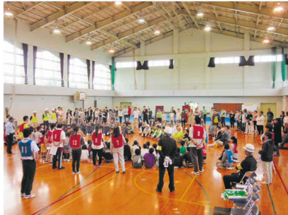
本年度初めての試みで、およそ200人が集まりました

東大崎小学校は全校児童94人で、学年の垣根を越えて仲良く遊んでいます。また、地域の方々も学校行事に積極的に関わって、私たちの活動を応援してくれています。 東大崎小では、防災意識を高め、災害時には自分の命を自分で守るために、地震や洪水などを想定した予告無し避難訓練に取り組んでいます。昨年9月には、学校・地域合同の防災訓練を初めて行いました。家で大きな地震に見舞われた時に、家族とともに避難場所となっている学校への避難の仕方や、備蓄しているアルファ米の試食などを行いました。 災害時は助け合うことが必要のため、地域のコミュニティが大切だということが分かりまし