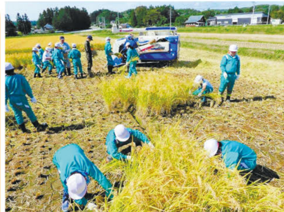
地域の方と一緒に、力を合わせて稲刈りだ!!

大沢小には、校舎の窓から見えるきれいな景色があります。春は桜が満開になり、夏はあざやかな緑の葉が茂ります。秋は紅葉が美しく、冬は雪景色。自然に咲いた花や委員会が植えた花もあります。このように、大沢小の周り、校庭には、たくさんの自然があります。これからも大沢小の自然を守り、大切にしていきたいと思っています。