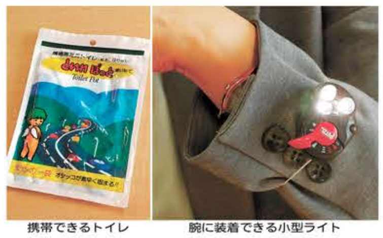
携帯できるトイレ 腕に装着できる小型ライト