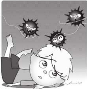
イラスト 杉浦 才樹

の持ち方で強くなったり、弱くなったりすることがある。「ほくは風邪なんかひかないぞ」という気持ちを体の中の免疫だ。「風邪